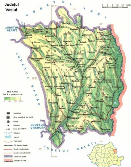
Fig. 7 Harta Județului Vaslui

Conform recensământului din 2021, populația municipiului Vaslui era de 63 035 locuitori, în creștere cu 13,7% față de recensământul precedent din 2011, când au fost înregistrați 55 407 de locuitori. Ultimele date disponibile arată că majoritatea sunt români (98,62%), cu o minoritate de romi (1,19%). Din punct de vedere confesional, majoritatea locuitorilor sunt ortodocși (88,58%), 2,12 sunt de altă religie, iar pentru 9,29% religia este necunoscută. Statisticile oficiale arată că județul Vaslui are cel mai mic PIB pe cap de locuitor din România 5 . Principalele activități economice sunt concentrate în agricultură (aproximativ 400 000 de hectare din suprafața județului sunt agricole), dar și în industrii precum cea alimentară și a băuturilor, industria textilă, industria constructoare de mașini și industria încălțăminte.