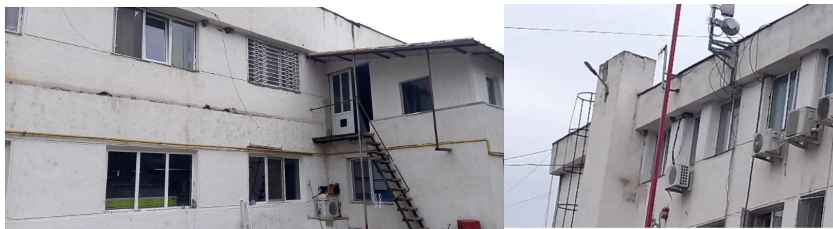
Fig 5 Clădirea actuală este întreținută deficitar și este vizibil deteriorată

Sistemul constructiv al clădirii este reprezentat de grinzi continue din beton armat și pereți portanți din zidărie confinată cu elemente din beton armat.