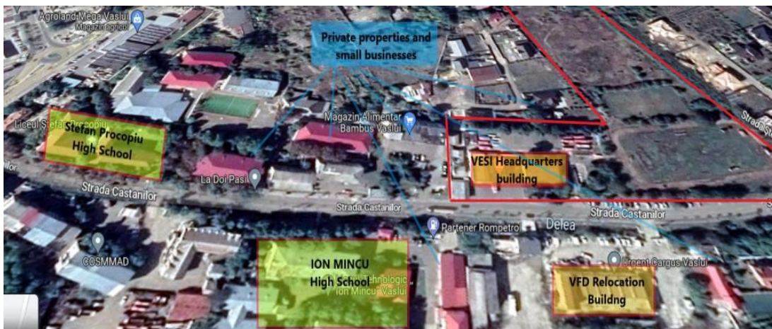
Fig.4 - Zona din vecinătatea ISUJ Vaslui

Vecinătățile sunt în mare parte caracterizate de o densitate scăzută a populației și clădirilor, cu câteva blocuri de apartamente și case unifamiliale, precum și câteva spații utilizate pentru activități economice și magazine mici. La aproximativ 200 de metri se află Liceul "Ștefan Procopiu" și o zonă ceva mai dens populată, cu blocuri de apartamente cu 4 etaje