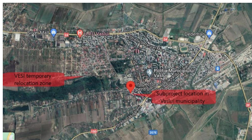
Fig.2 Localizarea ISUJ în prezent și după relocare

Activitatea în domeniul situațiilor de urgență din județul Vaslui constă în asigurarea serviciilor de stingere a incendiilor și de ambulanță SMURD pe o suprafață de 5318 km pătrați, deservind aproximativ 395.500 de persoane din 449 de localități organizate în 86 de unități administrativ teritoriale din care trei municipii și două orașe.