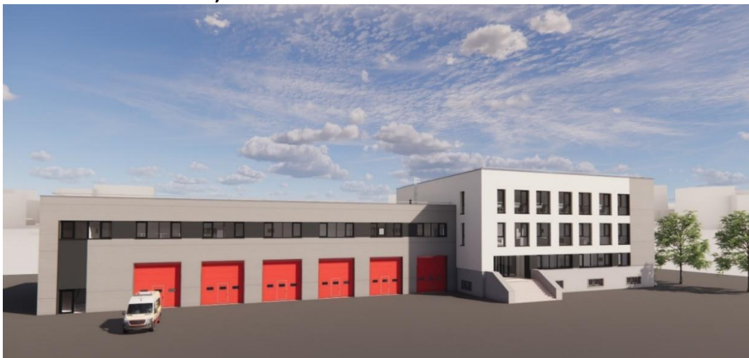
Fig. 6 Noua clădire propusă

Obiectivul ce urmează a fi atins în urma investiției este asigurarea condițiilor optime pentru desfășurarea activităților zilnice ale personalului ISUJ Vaslui și ale personalului de intervenție, dar și a spațiului de parcare a autovehiculelor de intervenție pentru a menține parametrii necesari activității operative de intervenție în situații de urgență. Totodată vor fi create condiții pentru pregătirea populației din zonă în vederea asigurării unei responsabilități efective față de diverse tipuri de riscuri potrivit nevoilor generate de situațiile de urgență apărute.